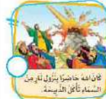
كان الله حاضرًا بتزول لهم من السماء تأكل الذبيحة.